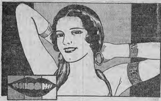
Lunes, Martes, Miércoles 3 MATICES MAS BLANCOS

¡Dientes que sonríen! perfectamente en un instante hasta descubrir el blanco perline del esmalte —sin causar el menor daño. La maravillosa espuma de KOLYNOS desaloja los restos de alimentos en estado de fermentación y neutraliza la acidez; elimina la película amarillenta que tanto afecta y deja la boca con una deliciosa sensación de frescura y limpieza. Si desea tener dientes más blancos, libre de caries y encías firmes y rosadas, pruebe el KOLYNOS. 3 días le bastarán para convencerse.