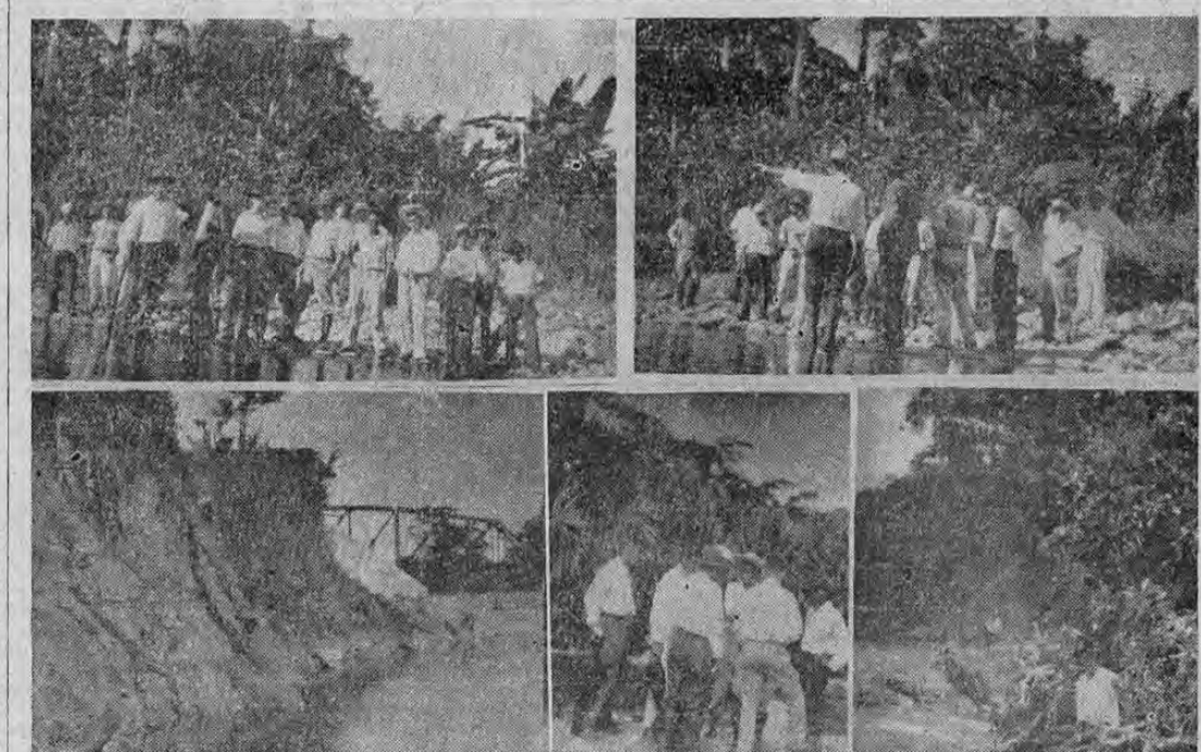
En las fotografías aparecen los ingenieros Galbraeth y Volio acompañados de los nuevos municipios de Limón en el lugar donde se captan las aguas del río de Aguas Zarcas para la ciudad de Limón. En otro de esos cuadros las mismas personas y su comitiva en Río Banano. Puede apreciarse también en una de las fotos la antigua cañería destruida a consecuencia de las grandes avenidas de agua ocurridas a consecuencia de las lluvias.